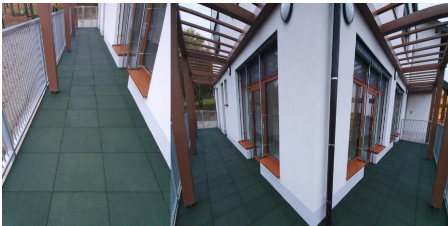
Terasa pred novim delom vrtca