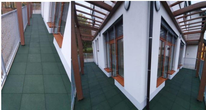
Terasa pred novim delom vrtca